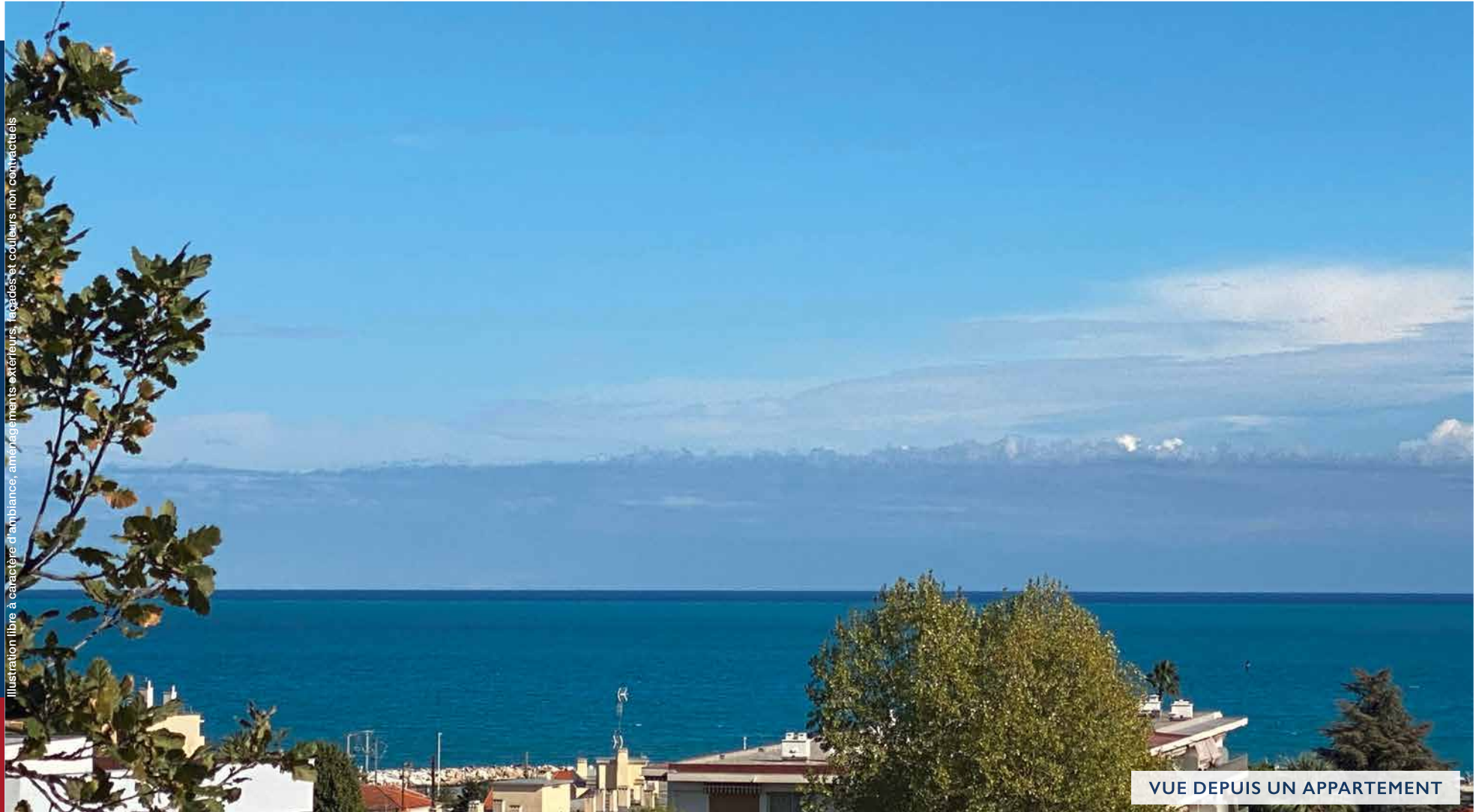
Illustration libre à caractère d'ambiance, aménagements extérieurs, façades et couleurs non contractuels