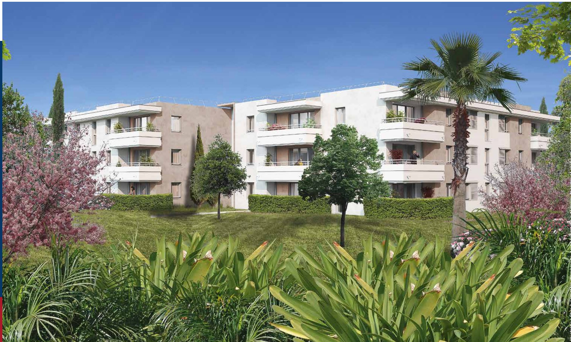
Illustration libre à caractère d'ambiance, aménagements extérieurs, façades et couleurs non contractuels