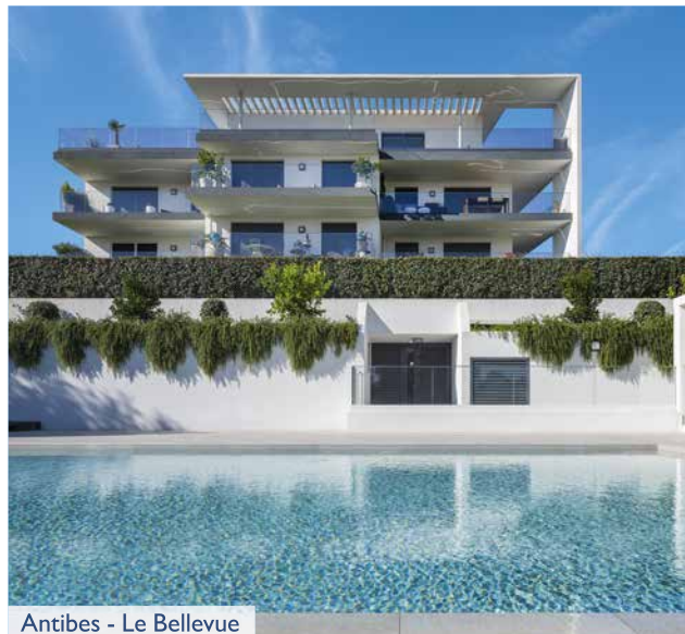
Antibes - Le Bellevue

Promoteur-constructeur visionnaire, Promogim traduit son engagement global et durable en matière de qualité avec des résidences répondant à des normes de plus en plus élevées en matière d'environnement et d'économie d'énergie telle que la Réglementation Thermique RT 2012.