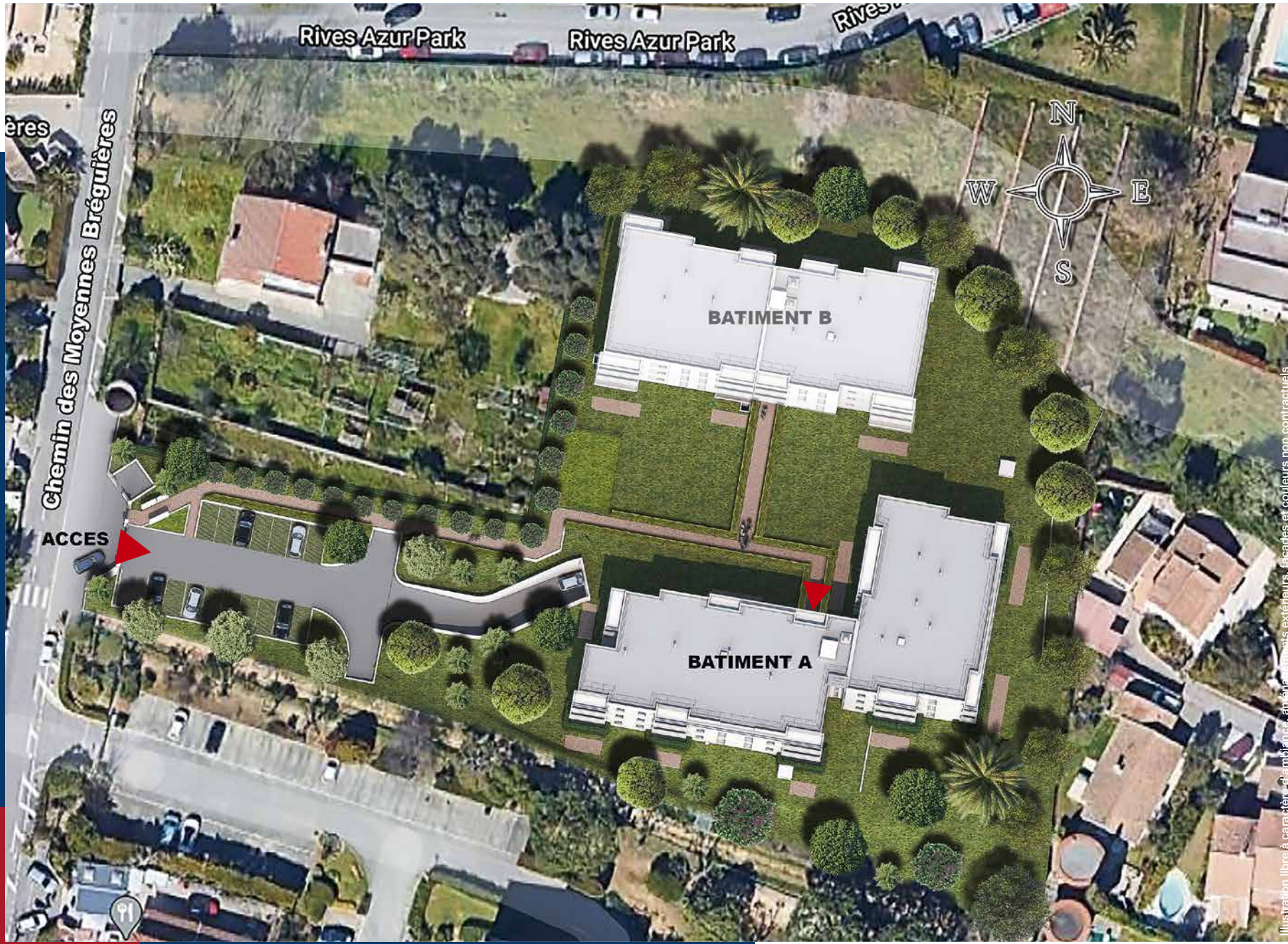
Illustration libre à caractère d'information. Les couleurs, les formes, les volumes, les textures, les matériaux, les finitions, les équipements, les accessoires, les mobiliers, les végétaux, les couleurs et les hauteurs sont non contractuels.