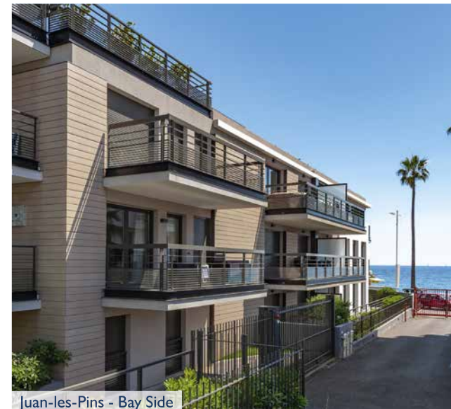
Juan-les-Pins - Bay Side